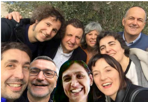
Equip de deganat