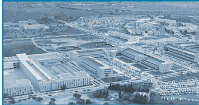
Edifici Guillem Cifre de Colonya. Campus Universitari de la UIB

La finalitat de la diplomatura d'Educació Social és la formació de professionals capaços d'intervenir en diferents camps relacionats amb la inadaptació social, l'animació sociocultural, l'educació d'adults, el desenvolupament comunitari, etc. La figura de l'educador/a social és entesa com un/a professional que intervé en el camp social amb l'objectiu de modificar i millorar situacions personals i socials a través d'estratègies educatives.